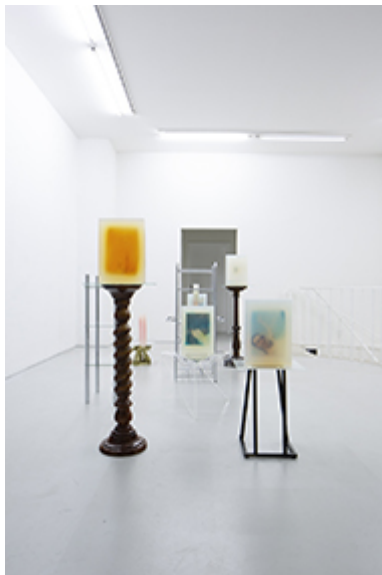
Angela Stiegler, "Reformhaus", Skulpturen, 2020