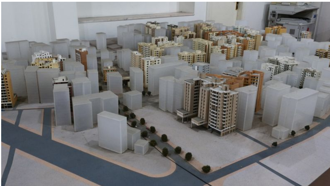
Sandra Schäfer, Constructed Futures: Haret Hreik, Videostill, 2017

Ich arbeite mit den Medien Video, Fotografie und Installation. Darin beschäftige ich mich mit den Herstellungsprozessen von städtischen und transregionalen Räumen, Geschichte und Bildpolitiken. Zumeist entstehen diese Arbeiten entlang von Recherchen, in denen ich mich mit den Rändern, Lücken und Diskontinuitäten der Wahrnehmung von Geschichte, politischen Kämpfen und geopolitischen Räumen auseinandersetze.