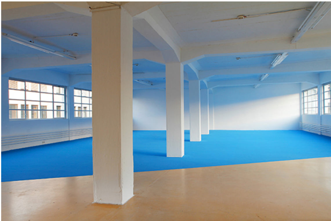
Schirin Kretschmann, Superblau, Pigment, plaster, Bregenzer Kunstverein 2016, © Schirin Kretschmann

Meine künstlerische Arbeit ist situativ und prozessual angelegt, indem sie von einer anfänglichen künstlerischen Setzung ausgeht und Entwicklungen oder fluktuale Prozesse anstößt, in denen den Betrachter*innen in der Regel selbst eine aktive Rolle zukommt und Wahrnehmung als ein vielfältiger, synästhetischer, sich beständig wandelnder und somit unabgeschlossener Prozess vorausgesetzt wird. Die Intervention eines Materials in spezifische Ausstellungskontexte ist jeweils eine direkte Reaktion auf die Bedingungen der jeweiligen Kontexte und ihre materiellen Bestandteile.