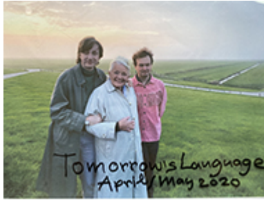
Philipp Gufler u. A., Flyer Ausstellung, 2021